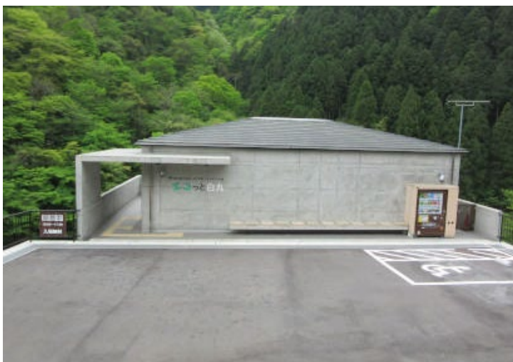
エコっと白丸の外観

( https://www.kotsu.metro.tokyo.jp/other/hatsuden/saienekan_calendar/ ) をご確認ください。