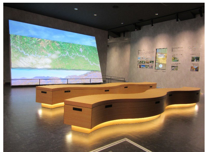
ジオラマシアター