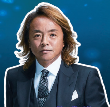
大会アンバサダー 元サッカー日本代表 北澤豪さん

参加都市(予定) ●北京 ●カイロ ●ジャカルタ ●サンパウロ ●岩手県 ●宮城県 ●福島県 ●茨城県 ●東京都 全12チーム