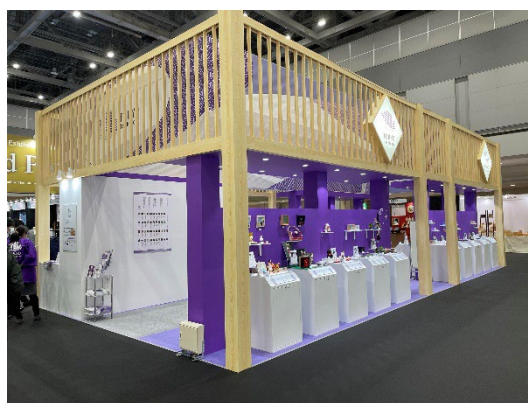
展示会出展の様子(普及促進)