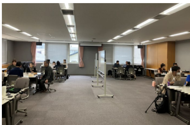
マッチング会の様子(商品開発)