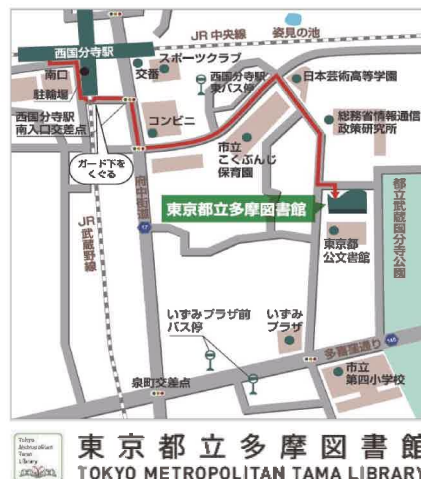
東京都立多摩図書館 TOKYO METROPOLITAN TAMA LIBRARY

東京都立多摩図書館 〒185-8520 東京都国分寺市泉町 2-2-26 TEL：042-359-4020