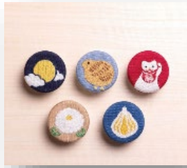
台東区産業フェアから誕生したコラボ商品

本区は、ものづくりをはじめとする多業種の中小企業が集積する地域として発展してきたが、近年、事業所・従業員数ともに減少が続く。主要な地域産業である「ファッションザッカ」産業は、コロナ禍を契機とした消費者動向の変化に直面している。こうした中、資金面・ノウハウ面や連携・交流の機会の創出など、中小企業の経営状況に応じた支援を行うとともに、大河ドラマというチャンスに官民一体で取り組むことで、事業者間のつながりを促し、積極的に挑戦する企業が集まる活発な地域産業を目指していく。