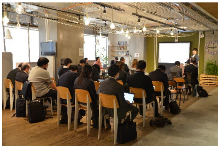
日野市 SDGs 推進事業者交流会（基調講演）