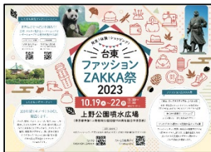
台東ファッションZAKKA祭2023