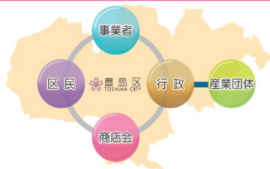
実現を目指す10年後の地域産業の将来像