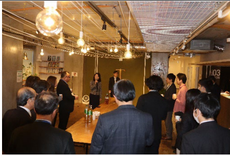
日野市 SDGs 推進事業者交流会

工業においては、事業所の廃業や移転が進み、企業間、企業と大学や産業支援機関等との連携の不足やデジタル化の遅れ等が課題となっている。一方、商業においては小売店を中心とした個店の減少、高齢化による担い手不足、事業承継問題、加えて、かつては市内商業の活性化を担っていた商店会組織の活動減少等、課題は多様化している。課題解決へ向け、様々な主体との連携促進による新たな事業や取組の創出、企業の競争力強化等に向けた成長支援が必要である。