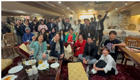
つながりを生む起業家交流会

小売業や飲食サービス業といった労働集約型の業種が集積している本区の産業構造の特性上、人手不足の影響を受けやすく、売上減少を招くなど区内事業者は厳しい状況に直面している。地域経済の活性化の実現に向け、中小企業者および伝統工芸の「販路拡大・売上拡大支援」、多彩なメニューから組み合わせ自由な補助制度を活用した「経営基盤強化」、地域全体で起業家をサポートする「起業支援・地域コミュニティの活性化」の3点を柱に、事業を展開する。