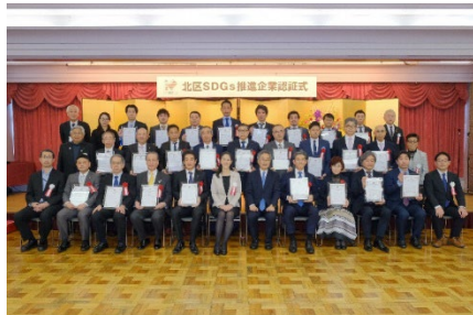
令和5年度北区SDGs推進企業認証式の様子

本区の産業は比較的規模の小さい事業所が集積している。このため、個々の事業所単位によるプロモーションや情報発信は決して強いものではない。また、度重なるコストの上昇や、社会全体が環境問題等に関心が高まるにつれて、事業者の規模に関係なく社会の一員として強い規範が求められるなど、経営者は限られた経営資源の中で難しい舵取りを求められている。北区産業が直面している課題の解決を図るため、「Partnership(連携)―多様な主体との連携により、地域経済の好循環の形成」と「Change(変化)―人材育成・DXを核とした企業の成長支援」の2つの考え方に基づき、取り組んでいく。