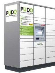
宅配ボックスの一例 PUDO ステーション

イベント当日は宅配ボックス・ロッカーの体験コーナーを用意し、デモ機を設置しています。これを機に、宅配ボックス・ロッカーをぜひ体験ください！