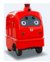
配送ロボット 「デリロ(TM) (DeliRo)」