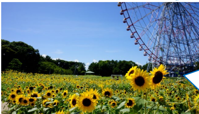
葛西臨海公園「ダイヤと花の大観覧車」とひまわり花壇