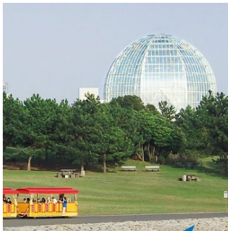
葛西臨海水族園の ガラスドーム

親子で楽しむ夏休み！水上バスで葛西臨海公園に行こう！ （葛西臨海水族園・ダイヤと花の大観覧車チケットと軽食付）