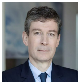
ノルベール・ルレ