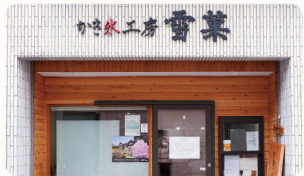
3 かき氷工房 雪菓