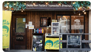
2 Smoke Beer Factory 大塚店 (NAMACHA Brewing)