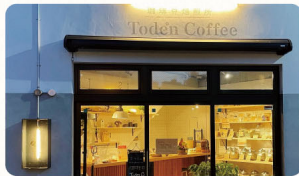
1 珈琲豆焙煎所 Toden Coffee