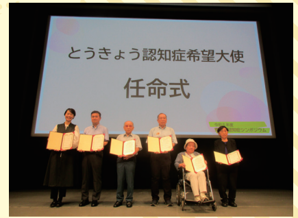
昨年度任命したとうきょう認知症希望大使6名

今回は、とうきょう認知症希望大使を中心としたパネルディスカッションを実施します。