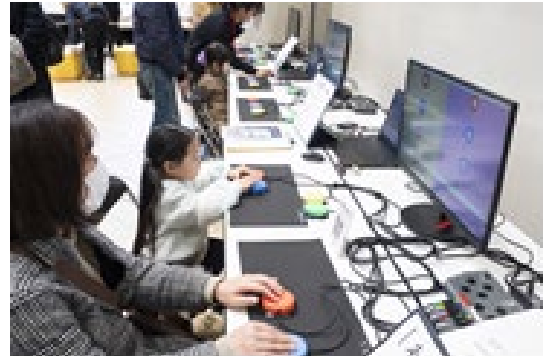
e パラスポーツ体験イメージ