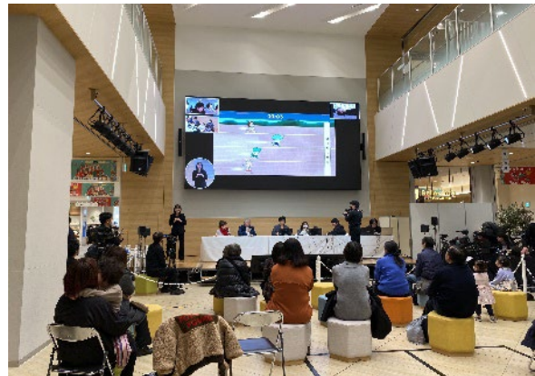
昨年度の交流会イベントの様子