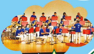
あきしまウインド オーケストラ音楽演奏