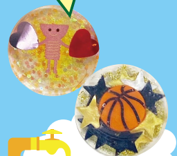
IoTクリエイター科 ジョブセレクト科 アクセサリ製作