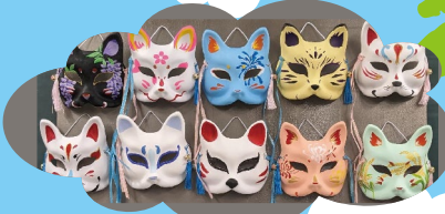
自動車塗装科 狐のお面に色を 塗ってみよう!