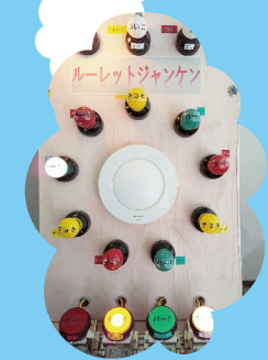
ビル管理科 ルーレットジャンケン