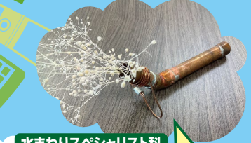
水まわりスペシャリスト科 一輪挿し製作