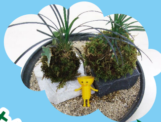
造園土木施工科 苔玉(こけだま)製作