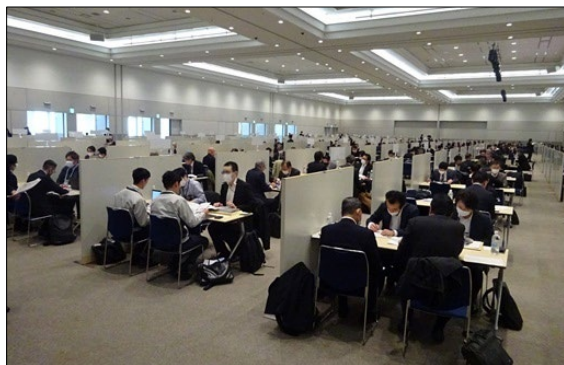
令和5年度に実施した「九都県市合同商談会2024」の商談風景 (会場: パシフィコ横浜 アネックスホール)

首都圏産業の国際競争力の強化を図るため、平成20年度から九都県市(埼玉県、千葉県、東京都、神奈川県、横浜市、川崎市、千葉市、さいたま市、相模原市)が連携して合同商談会を開催し、今回で17回目を迎えます。