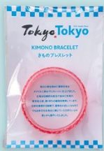
②きものブレスレット