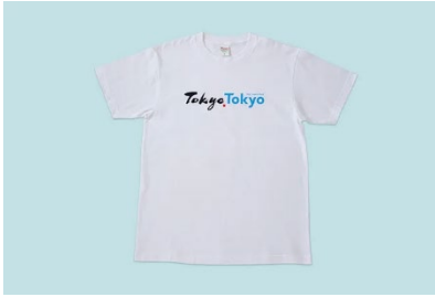
①Tシャツ 「Tokyo Tokyo □□」