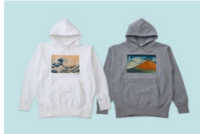
②フーディ 「葛飾北斎・富嶽三十六景」