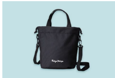
③ミニバッグ 「Tokyo Tokyo □□」