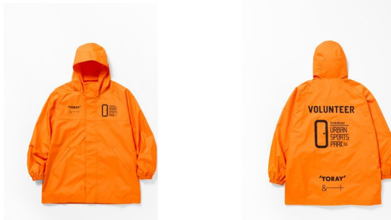
有明アーバンスポーツパーク ボランティアスタッフウェア

※施設開業時のスタッフウェアは、日本国内で回収された PET ボトル由来の「&+®」を原料の一部として使用しています。