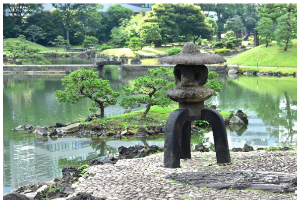
旧芝離宮恩賜庭園