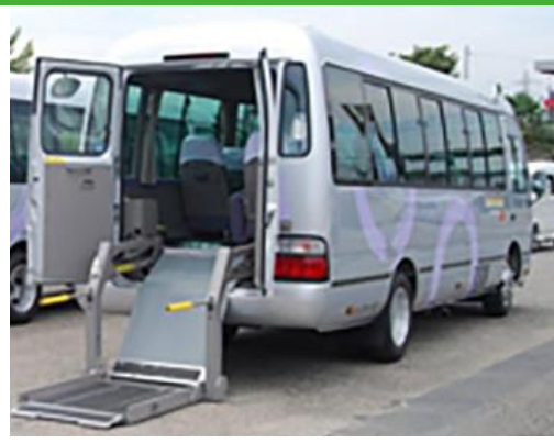
利用予定のリフト付き小型バス(イメージ)