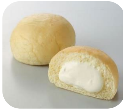
ふっくりーむ（下北沢）