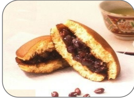
能登大納言どらやき (八重洲いしかわテラス)