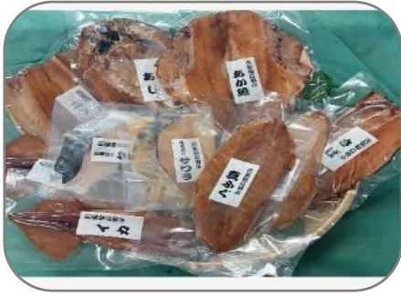
一夜干し (出張輪島朝市)

地震や豪雨で大きな被害を受けた石川県や山形県の復興に向け特産品等を販売する応援ブースを設けます。