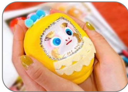
はっぴーだるまの絵付け （足立区）