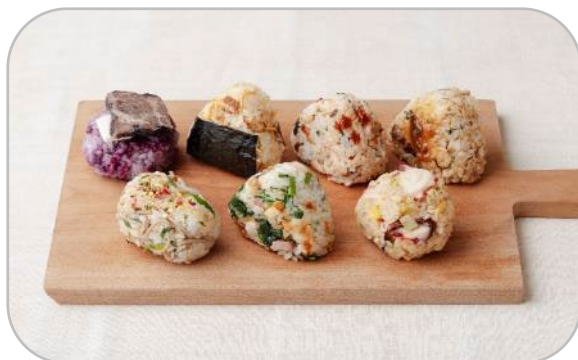
地域それぞれの食材等を使った7種類のオリジナルおにぎり

観光協会とオレンジページのコラボによる都内各地の特産品を使ったオリジナルおにぎりをスタンプラリーに参加された方にご提供します。