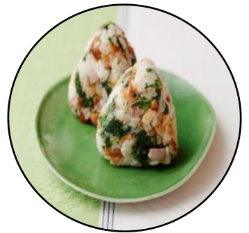
明日葉とナッツの オイルおにぎり