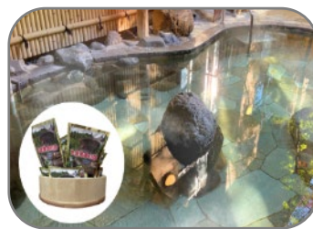
つるつる温泉 （日の出町）