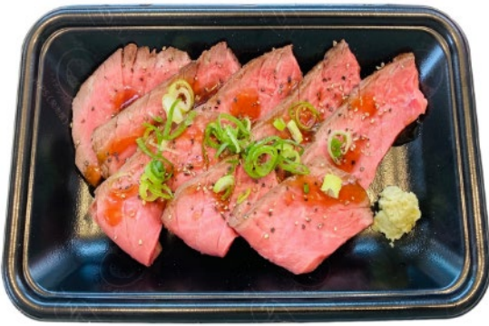
ローストビーフ（吉祥寺）