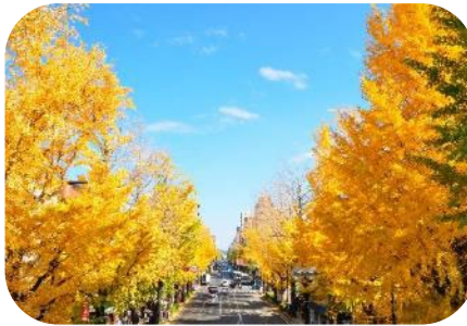
八王子観光コンベンション協会