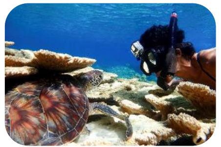
小笠原村観光協会