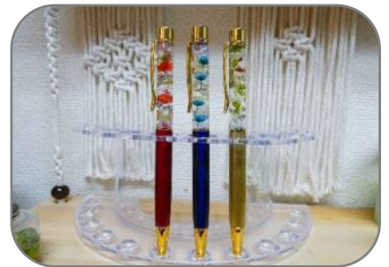
ハーバリウム クラフト体験 （三宅島）