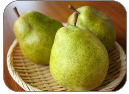
ラ・フランス (おいしい山形プラザ)