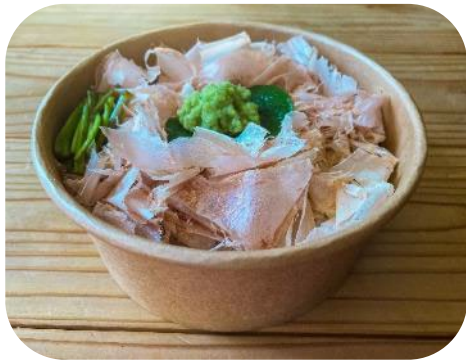
ミニわさび丼（奥多摩）