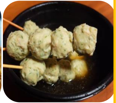
アシタバ鶏団子（大島）