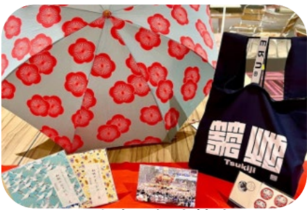
中央区観光協会 /中央区観光情報センター