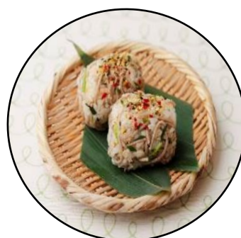
内藤とうがらし 七色そばおにぎり