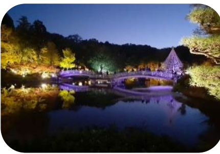
町田市観光コンベンション協会