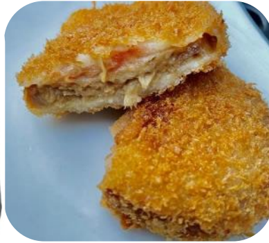
もんじゃころっけ（浅草）