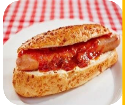
ホットドッグ (サルサwithチーズクリーム)（福生）