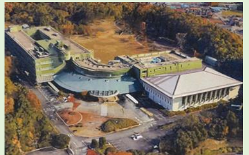
全棟：築36年（昭和63年竣工、平成17年改修）