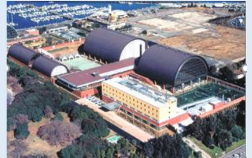
スポーツ棟・文化学習棟：築48年（昭和51年竣工） 宿泊棟：築20年（平成16年竣工）