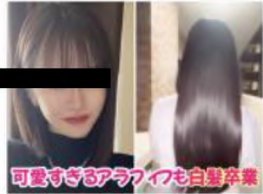
可愛すぎるアラフィフも白髪卒業

私がやって後悔している美容 ワースト1位が 白髪染め 。 頭皮も生え際も真っ白なので、 ここ数年は月1〜2回のペースで 染めてもたまりません。