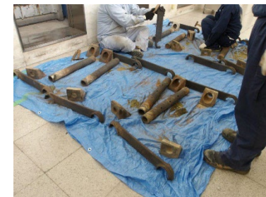
ロストル交換作業