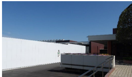
改築工事中の瑞江葬儀所

瑞江葬儀所が歴史と格式を兼ね備えた極めて公共性の高い施設であることを重く受け止め、火葬炉等各種施設の維持保全を的確に継続し、葬儀所に心さわしい環境と厳肅性を確保。また、使用受付・許可、徴収業務、火葬接遇業務等を、心をこめて確実に円滑に実施。