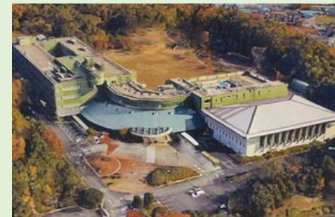
全棟：築36年（昭和63年竣工、平成17年改修）