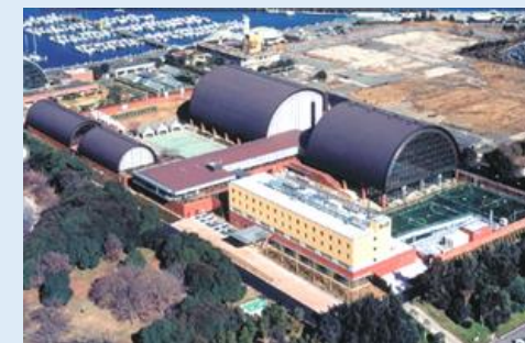
スポーツ棟・文化学習棟：築48年（昭和51年竣工） 宿泊棟：築20年（平成16年竣工）