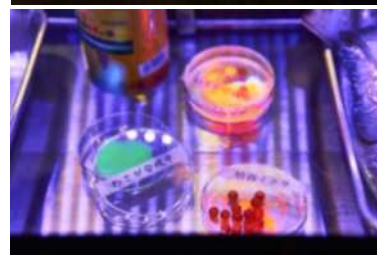
[上・中] 参考写真：市原えつこ「ディストピア・ランド」