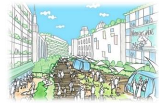
にぎわいと交流の場としての公共的空間が創出されます