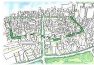
東京に新しいみどりのネットワークが形成されます