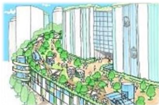
地区間をつなぐ歩行者ネットワークが創出されます