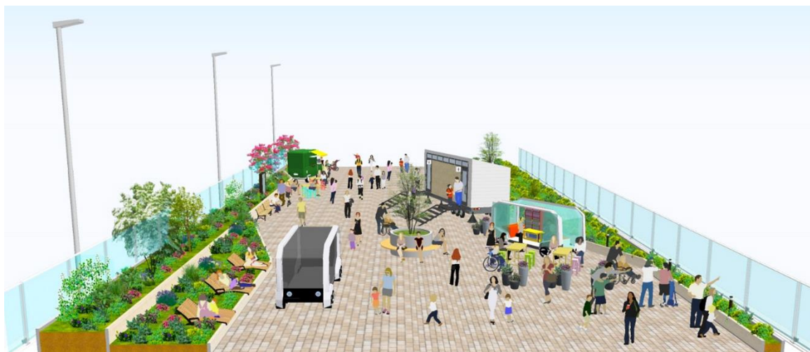
整備内容の例（幅員が約 16m 以上の区間）