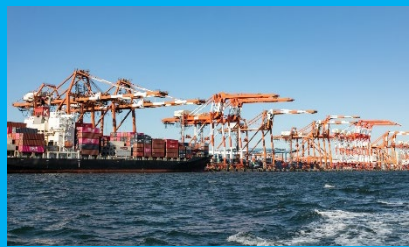
大井コンテナふ頭