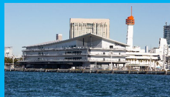
東京国際クルーズターミナル