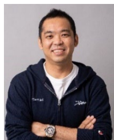
小泉 文明 株式会社メルカリ 取締役会長等