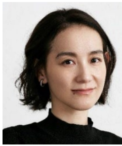
篠原 ともえ デザイナー アーティスト